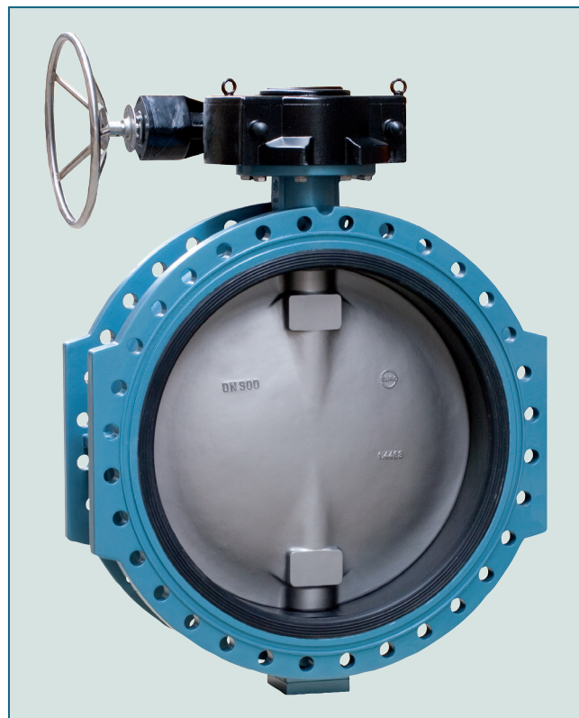
Двухфланцевый затвор с короткой монтажной длиной для применения в сложных условиях эксплуатации.